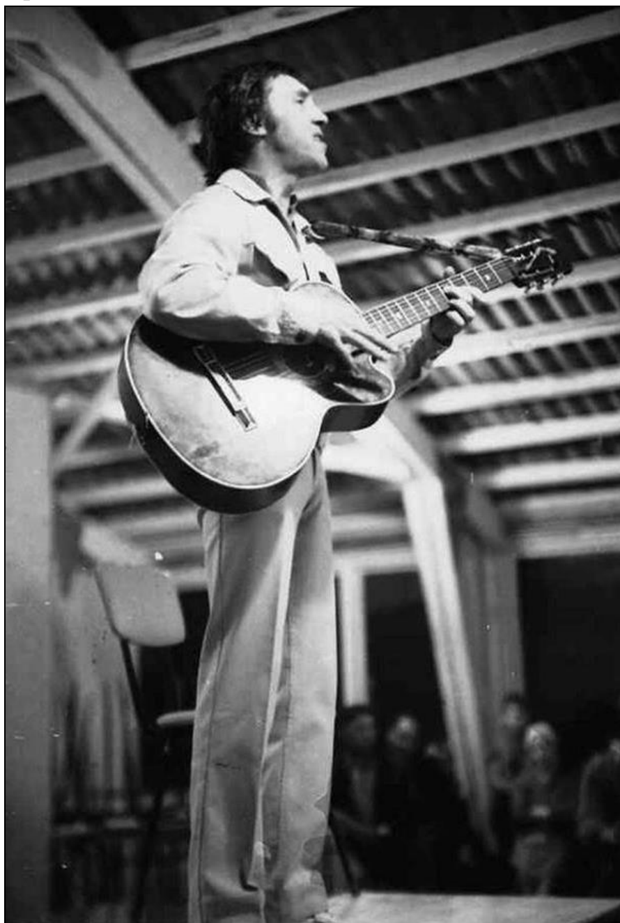
Концерт Владимира Высоцкого в Сатино. 4 июля 1974 г.